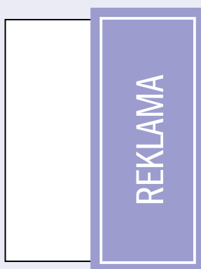
1/2 strony pion